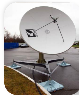
Мобильная приемная станция УниСкан™