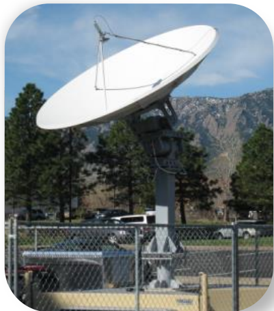
Vexcel Corp., США