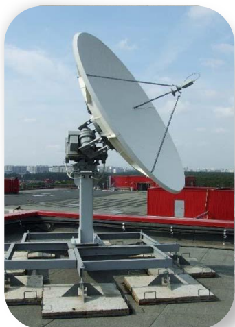
УниСкан™ (2.4 м)