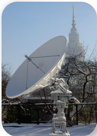
УниСкан™ (3.0 м)