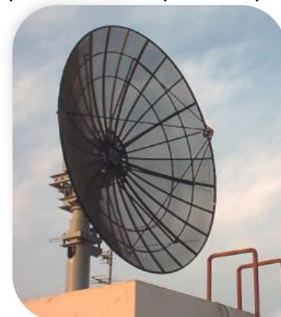
Global Scan Technologies LLC, ОАЭ