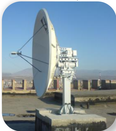
Центр геодезии и картографии, Армения